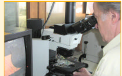
Er hatte stets die technische Entwicklung der Leiterplatte genau im Blick.