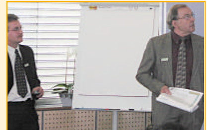
Vor Laien oder vor Fachpublikum: Seine Fachvorträge hatten stets Gewicht.