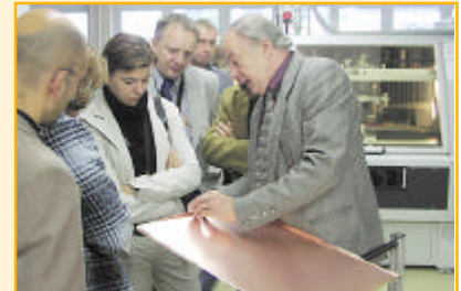
Seine Betriebsführungen galten als lehrreich und kurzweilig.