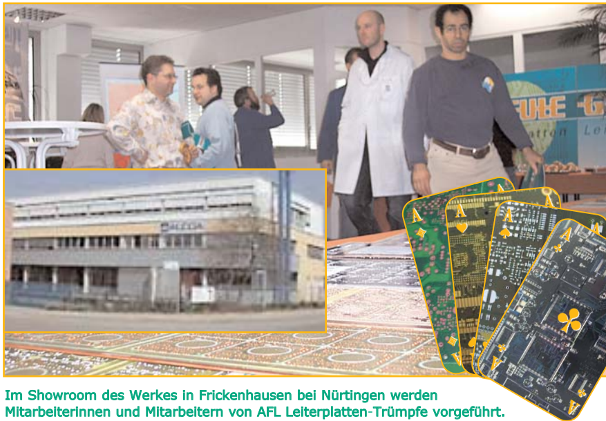
Im Showroom des Werkes in Frickenhausen bei Nürtingen werden Mitarbeiterinnen und Mitarbeitern von AFL Leiterplatten-Trümpfe vorgeführt.

Greule-Team lässt sich bei Hausmesse in die Karten schauen