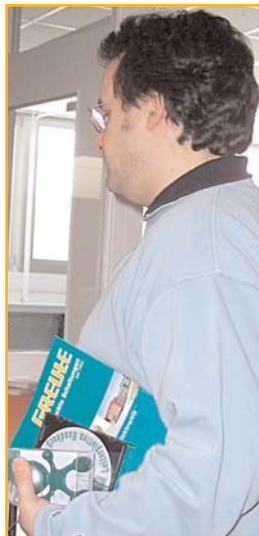
Interessierte Fachleute von AFL-Stribel in Nürtingen erfahren vom GREULE-Team all das, was sie schon immer mal über Leiterplatten wissen wollten.

Die ehemalige Firma Stribel aus Nürtingen, die im Jahre 1990 im weltweit tätigen Automobilzulieferer-Konzern ALCOA-Fujikura GmbH aufging, gehört seit Jahrzehnten zum festen Kreis zufriedener GREULE-Kunden. Im Archiv der Weltfirma befinden sich Zeichnungen von GREULE-Leiterplatten aus dem Jahre 1966. Am 4. April war das GREULE-Team zu Gast bei der Alcoa-Tochter AFL-Stribel im Werk Frickenhausen bei Nürtingen. Auf der hausinternen Veranstaltung ging es darum, Mitarbeiterinnen und Mitarbeitern mit Details aus der Leiterplattenfertigung vertraut zu machen und den Fachleuten Rede und Antwort zu stehen.