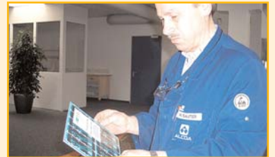
Manch einer, der täglich mit Platinen zu tun hatte, staunte über die Komplexität des Fertigungsprozesses.