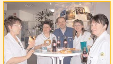
Auch die Verpflegung kam nicht zu kurz, und so fühlte sich die ALCOA-Belegschaft am GREULE-Stand sichtlich wohl.

+++ greule intern +++ greule intern +++ greule intern