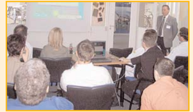
Vorträge zur Leiterplattenfertigung und zum Kundenservice der Firma Greule stießen auf breites Interesse.